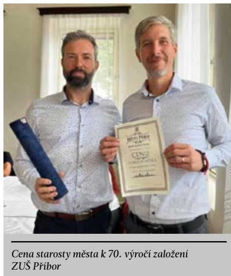
Cena starosty města k 70. výročí založení ZUŠ Příbor

Dne 26. července se uskutečnila vernisáž výstavy ARTFREUD 23–24 v Galerii Jane McAdam Freud na náměstí Sigmunda Freuda. Tato výstava opět přilákala mladé umělce nejen z blízkého okolí, ale i z dalších měst České republiky. Letos bylo do soutěže přihlášeno přes 50 děl, a já jsem velmi rád, že Příbor je vnímán jako místo, které poskytuje prostor umělecké tvorbě a prezentaci. Nejpočetnější zastoupení měli žáci ze ZUŠ Brušperk a ZUŠ