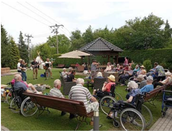
Opékání špekáčků + vystoupení kapely PŘÍKOP