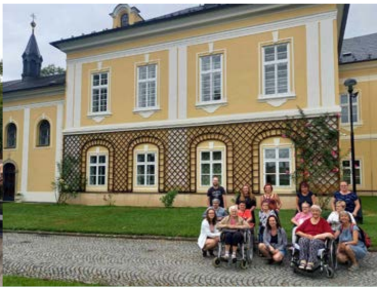
Návštěva zámku Nová Horka

se neslo v pohodové atmosféře. Chtěl bych poděkovat všem zaměstnancům, kteří se podíleli na tom, aby se při této akci příjemně bavilo na 54 uživatelů služby. Na chutové buňky byl také zaměřen „Pivní den“ s přednáškou a promítáním o zajímavostech kolem hořkého moku a především následnou degustací regionálních piv (Příbor, Kopřivnice, Hukvaldy, Ostravice, Vojkovice...) Velký ohlas sklidilo právě místní příborské pivo, nebo pivo višňové a medové chuti. U jídla a pití ještě zůstaneme. Podařilo se nám s uživateli společnými silami zpracovávat dary přírody . Zavařovaly se cukety a papriky, peklo, vyrábělo se lečo, sušilo ovoce, loupaly lískové ořechy, vařil se bezinkový likér... To vše