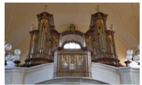
Varhany v kostele sv. Valentina

Varhany postupně dosluhovaly, a proto byla v roce 1972 provedena výstavba nových varhan známou krnovskou firmou Rieger