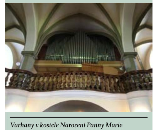
Varhany v kostele Narození Panny Marie